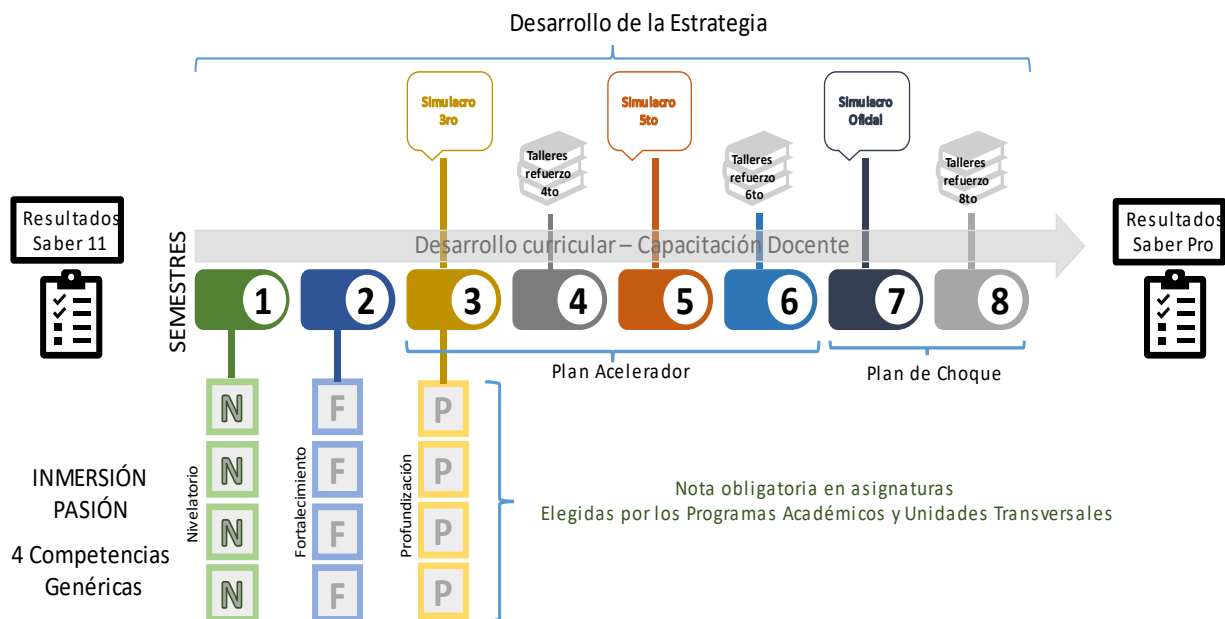
Figura 3. Estrategia General Saber Pro Areandina

La figura 3, permite comprender de una mejor manera la implementación de la estrategia general Saber Pro Areandina: