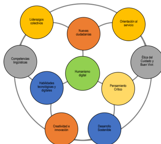
Figura 2. Nodos de formación. Sello Areandino

4.10 Habilidades tecnológicas y digitales: conjunto de habilidades necesarias para la sociedad de red actual, mediada por desarrollos tecnológicos y digitales que ya hacen parte integral de los procesos de mercado, y de los escenarios domésticos y personales. El dominio específico de estas habilidades ofrecerá ventajas estratégicas para quienes profundicen o se especialicen en estos campos.