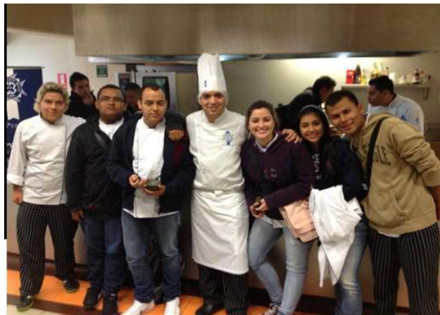
Foto 8. Grupo de estudiantes en viaje académico a Mistura Perú.