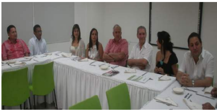
Fotos 11 y 12. Reseña e imagen de la visita del Dr. Ernesto Samper5 a la Seccional Valledupar.