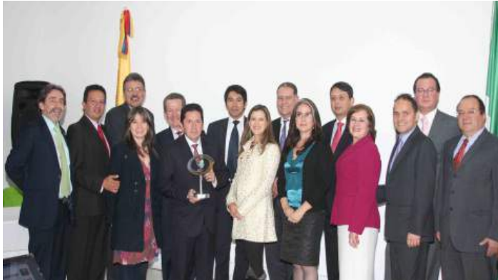
Foto 13. Entrega de reconocimiento como Empresa Ejemplar por parte de CEMEFI

de Proyección Social y Egresados y la Dirección de Mercadeo y Comunicaciones, se contó con la participación de 130 asistentes. 20 de abril