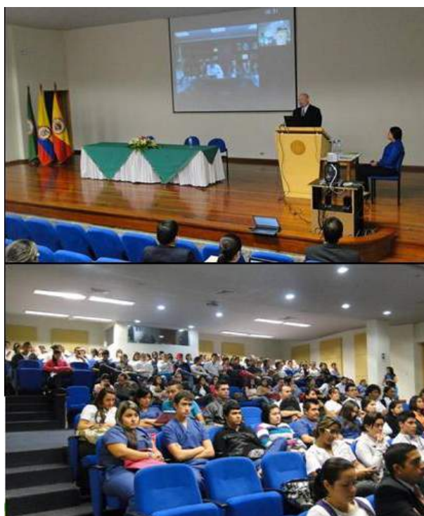
Fotos 9 y 10. Imágenes del V Encuentro de experiencias significativas en Internacionalización realizadas por la Fundación.