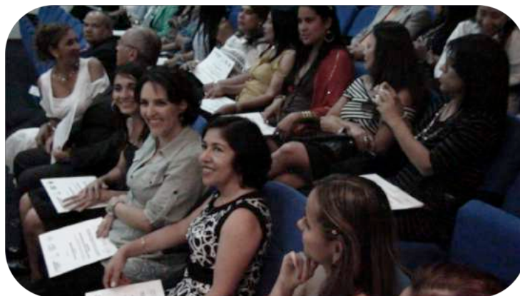
Fotos 4 y 5. Ceremonia de certificación en el Diplomado Docente como facilitador del aprendizaje. Seccional Pereira

En la sede Valledupar se llevó a cabo el programa “Formación a Formadores” dentro del cual se desarrollaron 7 módulos de 1 crédito académico cada uno, enfocados a la pedagogía y didáctica, contó con la asistencia de 22 docentes de planta de todos los programas de la sede. Igualmente se desarrolló una capacitación en investigación productiva, construcción de microcurrículos, PPA y PIFE, que contó con la asistencia de 18 personas del programa de derecho.