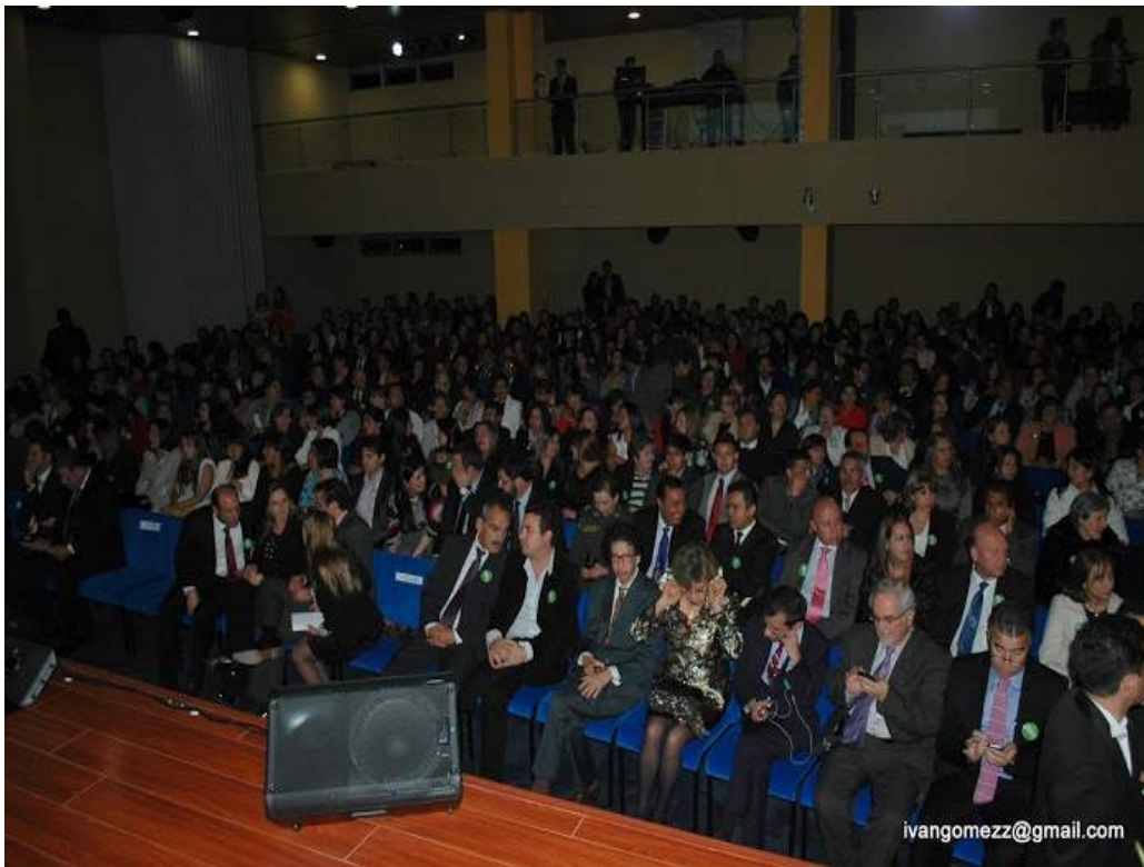
Fotos 2 y 3. Imágenes de la Inauguración de la Nueva Sede en Bogotá, Noviembre de 2012