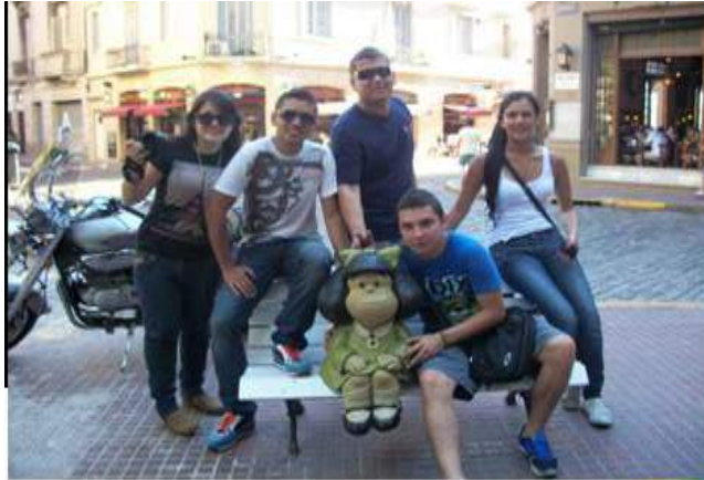
Foto 6. Grupo de estudiantes de mercadeo y Publicidad en Argentina